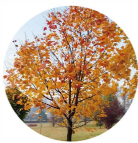
Arce negro ( acer monspessulanum )