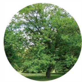
Morera ( morus alba )